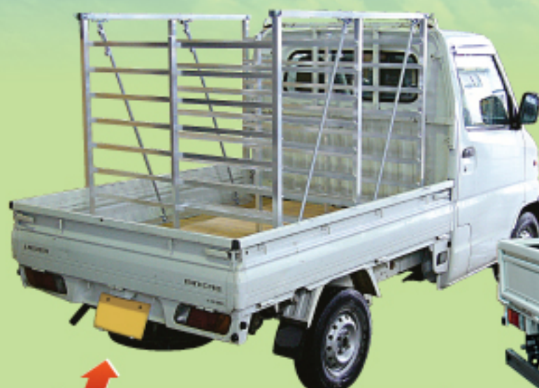
CX-64 軽トラックに1台搭載 64箱積み