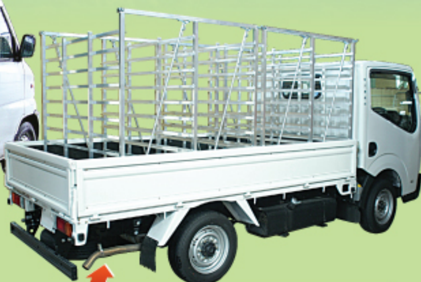
CX-100 普通トラックに2台搭載 200箱積み